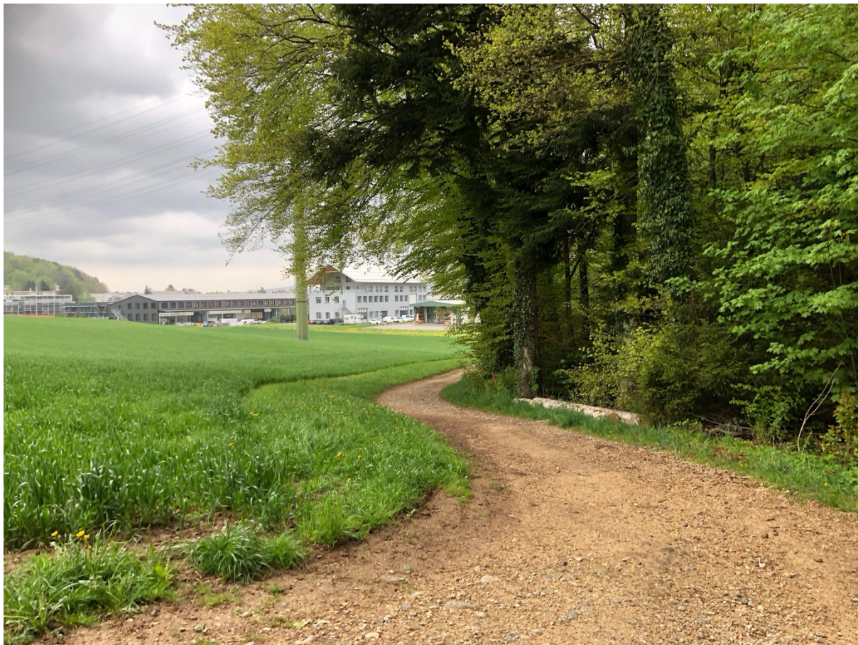
Flurweg im Allenberg