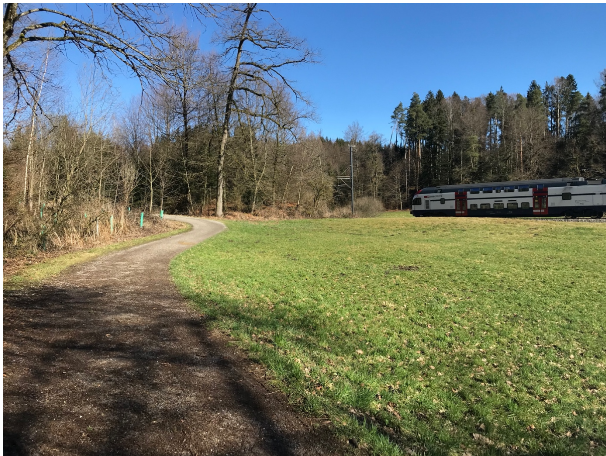
Flurweg im Schöneichwald