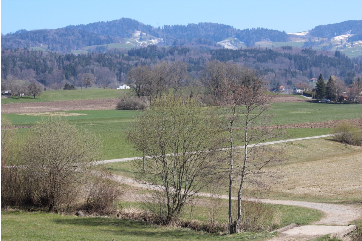
Blick Richtung Bachtel im Bereich des Rückhaltebeckens Meierwiesen