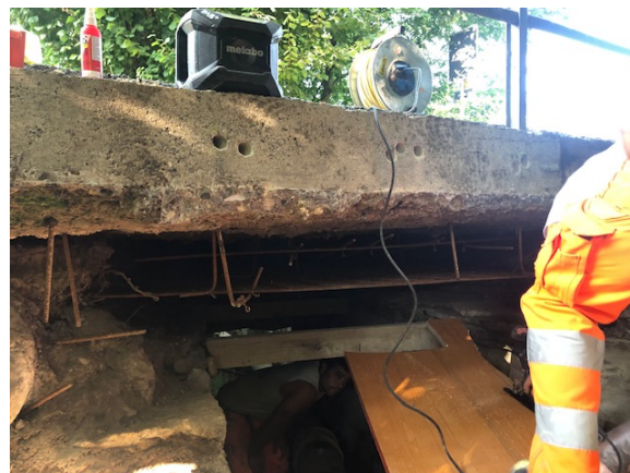
Sanierungsarbeiten an der Brücke

Durch den Abschluss und Einbezug der Flurgenossenschaft Wetzikon-Hinwil konnte der Perimeter im Osten durch Abtrennung des Gebietes auf Gemeindegebiet Hinwil auf die Gemeindegrenzen der Stadt Wetzikon vorgenommen werden. Dies war möglich, nachdem die Gemeinde Hinwil eine Unterhaltsgenossenschaft gegründet hatte und somit die «Rechtsnachfolge» für den betreffenden Teil bildet. Durch den Wegfall des Gebietes auf «Hinwilerboden» konsolidiert sich die Zahl der Genossenschaftlerin und Genossenschaftler auf rund 450 Mitglieder mit 1'000 Parzellen. Die Grösse der Genossenschaft wird sich durch abschliessende Auflagen im Jahr 2021 noch leicht nach oben verändern.